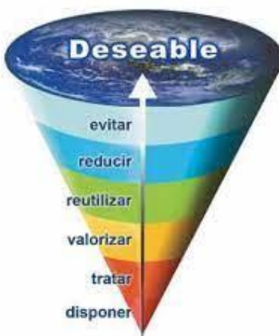
Ilustración 1 Gestión de Residuos-Principio de Jerarquización