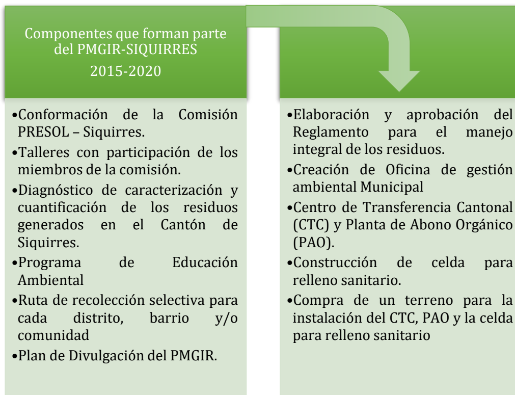
Ilustración 2 Componentes que forman parte del PMGIR-SIQUIRRES